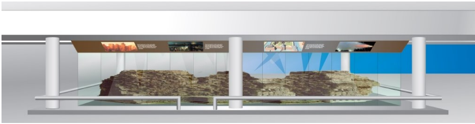
impressie inpassing in parkeergarage

Datum 9 december 2014 Ons kenmerk 14.502775